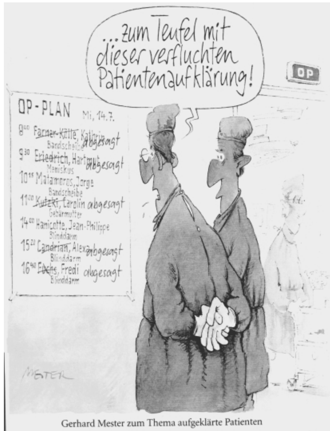
Gerhard Mester zum Thema aufgeklärte Patienten