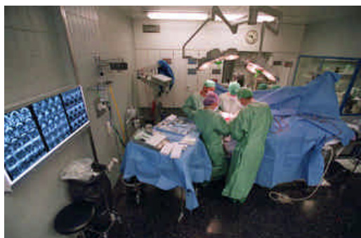
In Schweizer Spitälern wird viel gefuscher. Im Operationssaal wie auch in den Krankenzimmern

1000 Patienten sterben jedes Jahr, weil in Spitälern geschlachtet wird. Hauptursachen: Arbeitsüberlastung und Selbstüberschätzung der Halbgötter in Weiss.